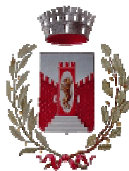
Comune di Illasi