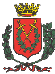
Comune di Caldiero