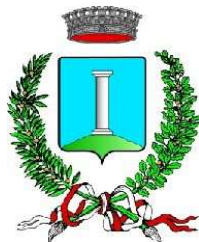
Comune di Colognola ai Colli